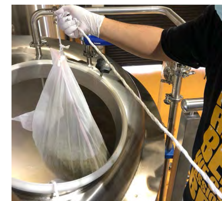
醸造釜にホップ投入