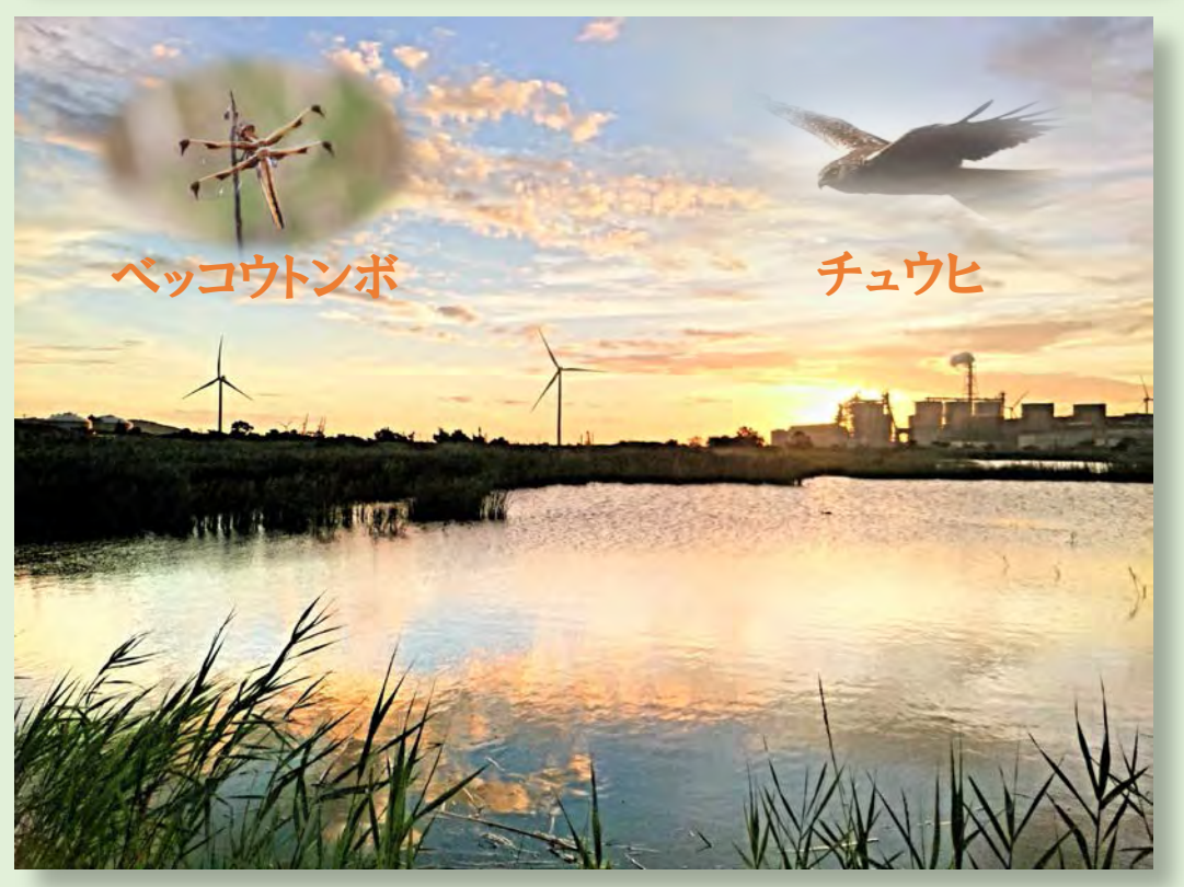
絶滅危惧種も複数確認されている響灘ビオトープの生物多様性保全に貢献

ホップ商品の売上の一部を環境保全に還元し、第六次産業 + a で地域の経済と社会にも貢献