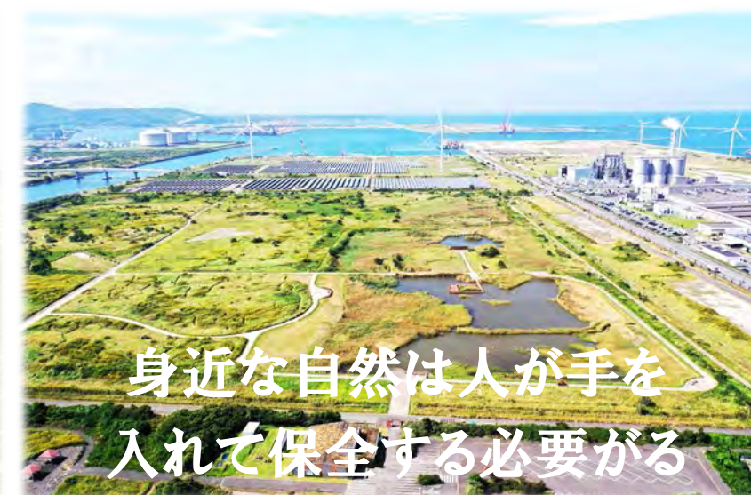
身近な自然は人が手をいれて保全する必要がある