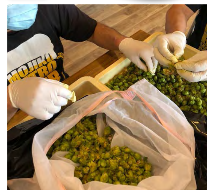
ホップ半割(ルプリン露出)