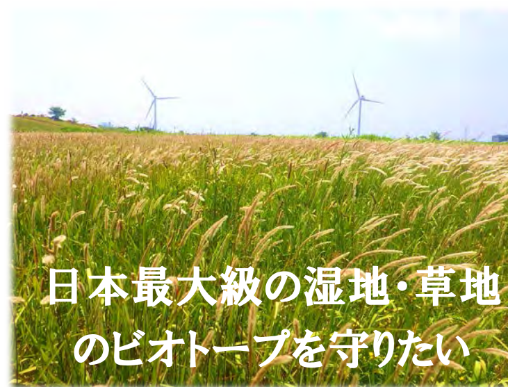
日本最大級の湿地・草地のビオトープを守りたい